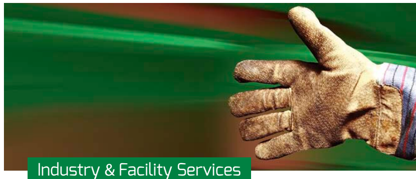
Industry & Facility Services

Für jeden unserer Leistungsbereiche stehen Ihnen zudem qualifizierte Ansprechpartner zur Verfügung, die Ihre Fragen kompetent beantworten und mit denen Sie jedes Projekt zweckdienlich besprechen und vorbereiten können.